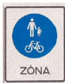
Gyalogos-kerékpáros övezet (KRESZ 26/j ábra)