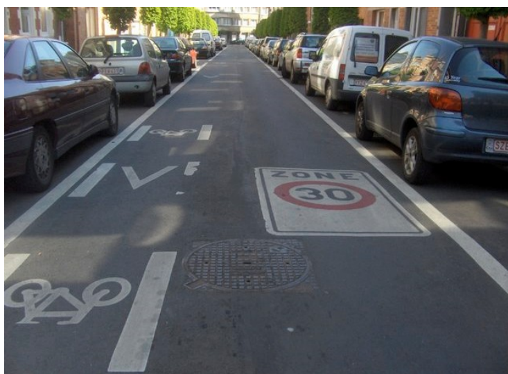
3,00 méter széles utca Brüsszelben

Egyirányú utca forgalomtechnikai kialakítása az ÚT 2-1.203 „Kerékpárforgalmi létesítmények tervezése” c. műszaki előírás 2009-es módosítás tervezete szerint.