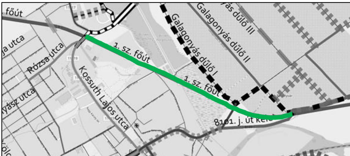
1.sz. főút szükséges, de hiányzó szakaszai

Ennek mellesleg nevelő, figyelemfelkeltő hatása is lenne, mert a gépjárművezetők nagyon hozzá vannak szok(tat)va a kizárólagos úthasználathoz, sok esetben ez az oka a gyalogosok számára fenntartott járdán közlekedő kerékpárosoknak is.