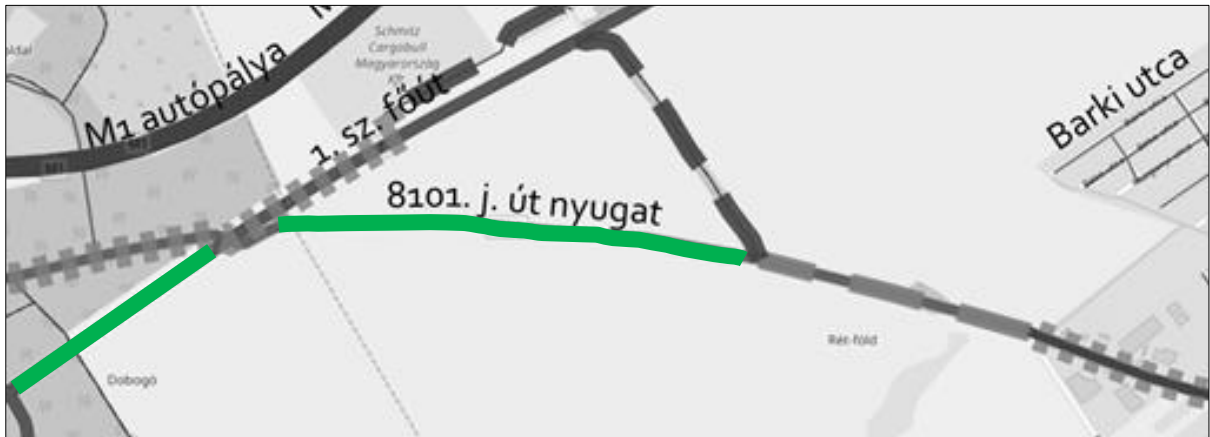
1.sz. főút és 8101. j. út javasolt szakaszai

Szintén jelentős kerülővel lehet eljutni a regionális kapcsolatokig (Etyek útirány esetén). Ezen a rövidebb szakaszon szerintem sebességkorlátozás (60) és kerékpársáv/-út lenne megfelelő.