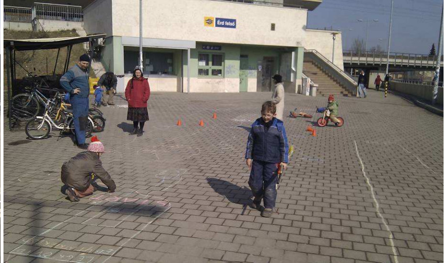
Az új helyszínen működés közben.

Végül a nagycsaládos kerékpárszervizesünk is eljött, hozott két újabb feljavított biciklit, megjavította egyik anyuka kerékpárját, aztán elvitt egy kicsi és kissé már agyonhasznált biciklit felújítani.