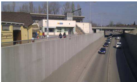
Miért ne lehetne használni? Kihasználni?

Sok itt a kocsi meg a beton, mégis van valamennyi embernek való használható hely.