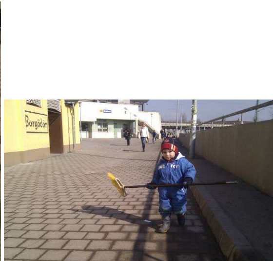
Elfogyott a Mézes Bodza, bummm!