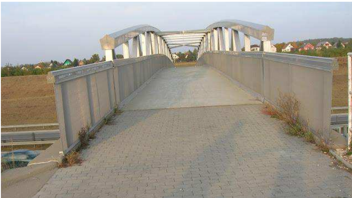
2. ábra - gyalogos híd az M0 fölött