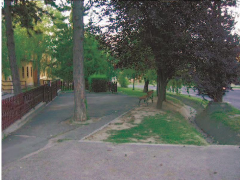
3. ábra - Veszélyes szakasszá válhat az iskola előtt a tervezett gyalog- és kerékpárút