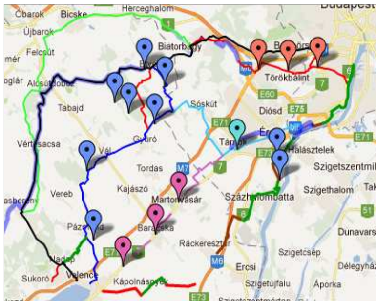
1. ábra Alternatívák Budapest és a Velencei tó között

Örömünkre szolgál országos fejlesztésekben segíteni. Úgy gondoljuk, hogy szervezetünk - felépítésének köszönhetően - ilyen mértékű intézkedésekben nagy segítséget nyújthat a döntéshozóknak. Ennek érdekében létrehoztunk egy nyilvános felületet, melybe számos javaslat érkezett. Ezen a térképen többet rajzoltak útvonalakat, de volt aki egyes látványosságot jelölt be a nyomvonal vonzáskörzetében.