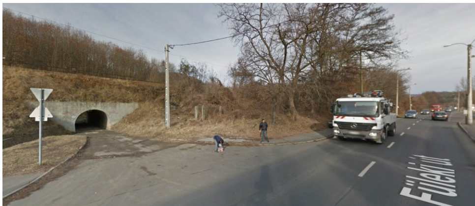
alagút a Kercseg-dűlő felé

Kérjük a javaslataink beépítését, az észrevételeink figyelembe vételét a hálózati terv véglegesítése során.