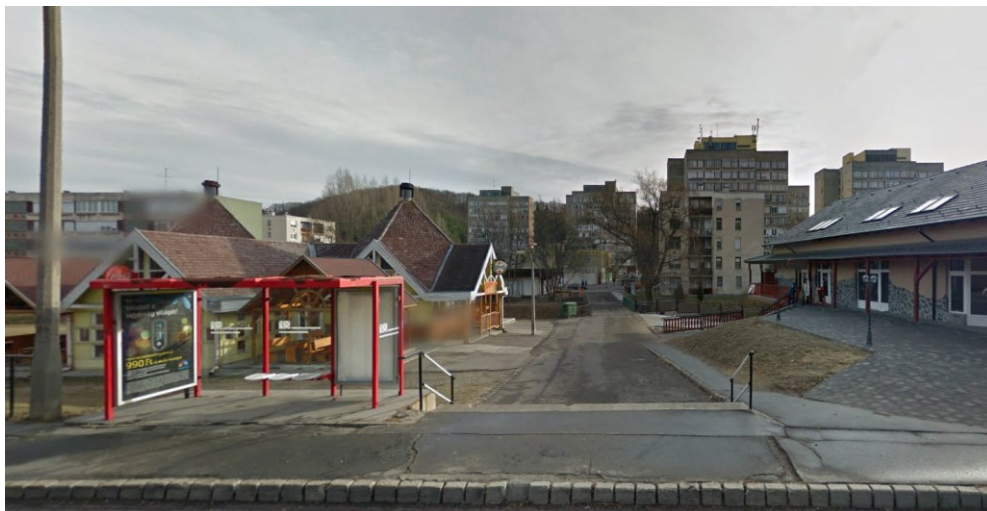
meglévő átkelési lehetőség a Tarján-patakon a Füleki út felől nézve