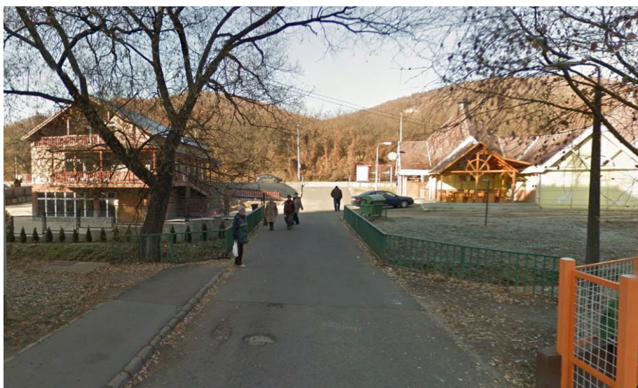
meglévő átkelési lehetőség a Tarján patakon a lakóterület felől nézve