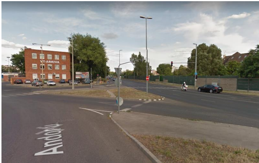
1. ábra A hiányzó járda helyén kitaposott fű jelzi az igényeket